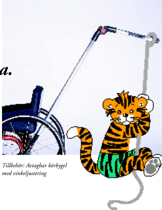
Tillbehör: Avtagbar körbygel med vinkeljustering