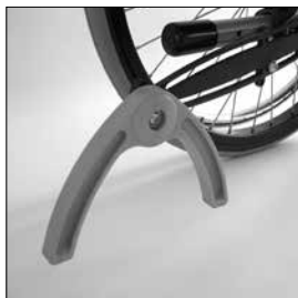
MA62 Pendlande tippskydd