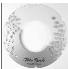
MG95 Ekerskydd - Dekor