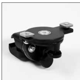
ME61 Monteringsfäste för skålade armstöd