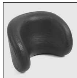
MZ 53 Huvudstöd