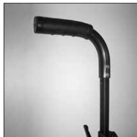
MD52 Höj-/sänkbara körhandtag