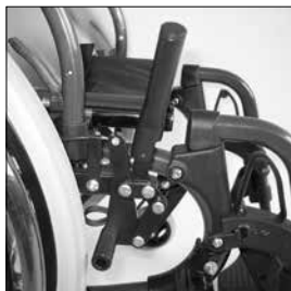
MH 08 Broms för enhandsdrift