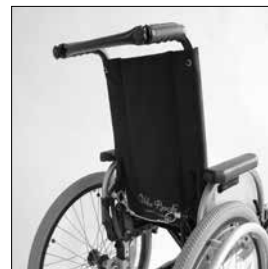
MD10 Vinkelställbar rygg 30°