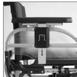
ME 05 Sidskydd, höjdbart