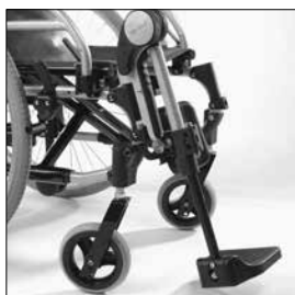
MB15 Vinkelställbart benstöd