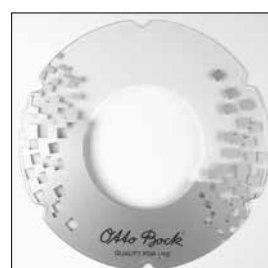
MG95 Designat ekerskydd