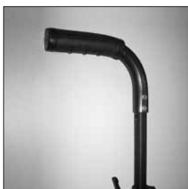
MD52 Körhandtag höjdställb.