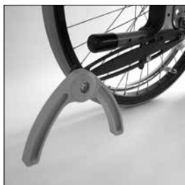
MA62 Pendlande tippskydd