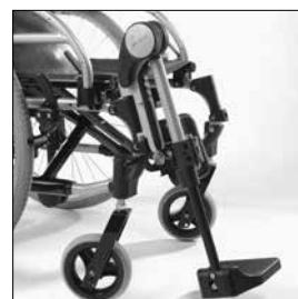
MB25 Vinkelställbart benstöd