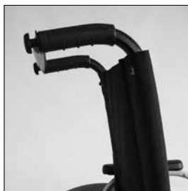
MD10 Rygg vinkelställb 30°