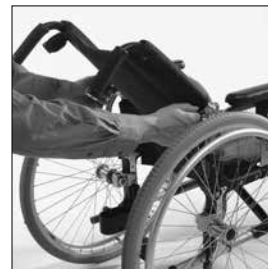
MD11 Vikbar rygg