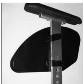
ME03 Avtagbart sidoskydd