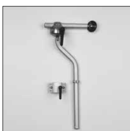
MZ55 Huvudstöd Offset