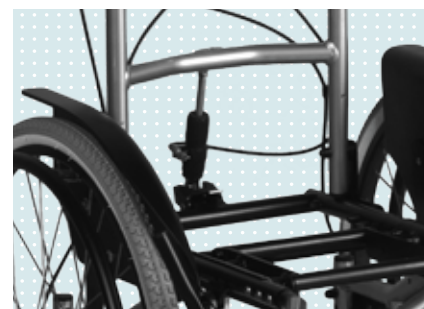
Ryggvinkling med snabbkoppling