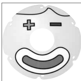
MG 93 Ekerskydd Clown