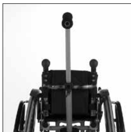
MD 57 Körbygel