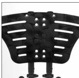
MB 04 Fotplatta vinkelställb.