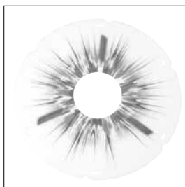
MG 91 Ekerskydd Eye Catcher