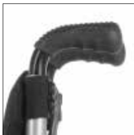
MD 50 Körhandtag fasta korta