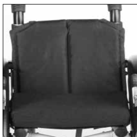
MC 01 Dyna