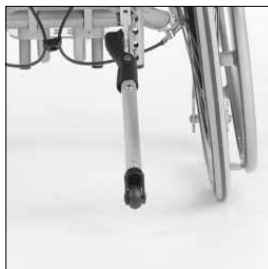
MA 55 Tippskydd