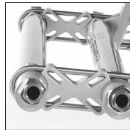
MG 85 Hjulbasförlängare