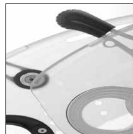
ME 10 Klädskydd designat