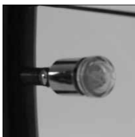
MZ 90 Ventillampor