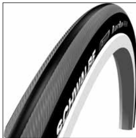
MG 39 Däck Schwalbe RightRun lätta