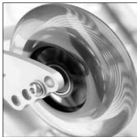
MF 21 Länkhjul lysdiod