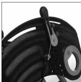
ME 02 Klädskydd