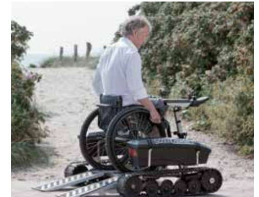
Enkelt att själv ta sig upp och ner